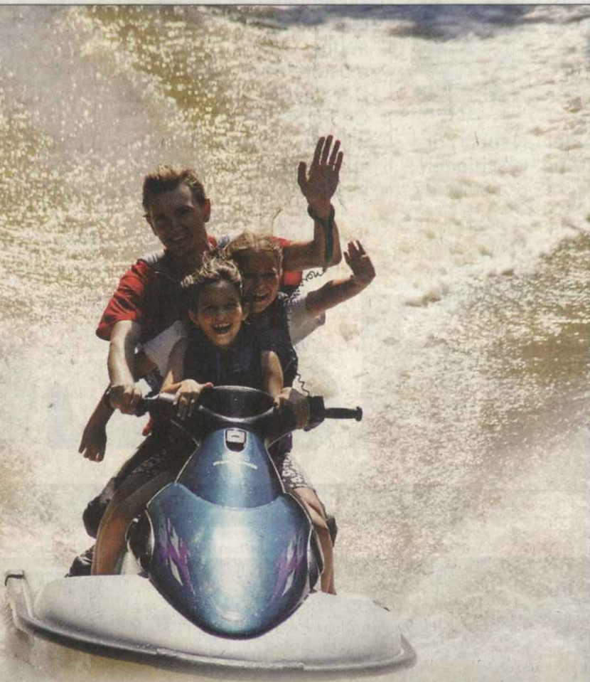
Wellenreiten Bei der „Wavesurf Jetski-Action“ des Astner Jetsportclubs Wavesurf testeten Kinder im Alter von sieben bis zwölf Jahren Quads und Jetskis. Insgesamt 16 Teilnehmer fuhren zuerst mit einer Spielekonsole Jetski-Rennen und sattelten dann auf richtiges Gewässer, den Ipfbach, um.