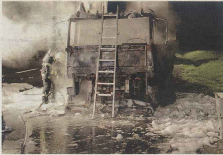
Die Fahrerkabine des LKW stand auf der A1 lichterloh in Flammen.

Beim ersten Einsatz im Ortsteil Kronau riss ein Mähdrescher das Kabel einer Hauszuleitung ab. Der dadurch entstandene Erdschluss setzte das Stroh in Brand. Dadurch wurde ein Gebäude sowie ein angrenzender Wald vom Feuer bedroht. Ein Florianijünger musste aufgrund von Flüssigkeitsmangel