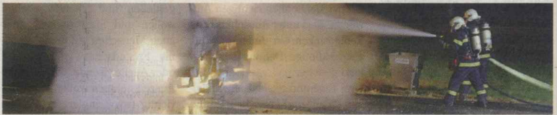
Es bestand die Gefahr, dass das Feuer auf ein Gebäude und den angrenzenden Wald übergreift.

ins nächste Krankenhaus gebracht werden. Doch den Feuerwehrmännern blieb kaum Zeit für die verdiente Nachtruhe. Bereits kurz nach Mitternacht ertönte der nächste Alarm. Die Führerkabine eines LKWs stand auf der A1 Fahrtrichtung Salzburg in Flammen. Der eingesetzte Atemschutztrupp konnte den Brand rasch löschen und so die Ladung und den Anhänger retten. 27 Grad Außentemperatur zu solch später Stunde verlangte den Männern alles ab, und so waren alle erleichtert, als dieser „heiße Tag“ erfolgreich zu Ende gebracht werden konnte.